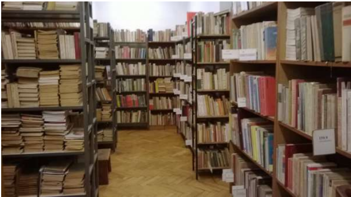
Magazyn główny naszej biblioteki – obecnie.

W roku szkolnym 2013/2014 zakończono komputeryzację biblioteki szkolnej. Stan na koniec czerwca 2014 roku to 22734 jednostki biblioteczne (książki i zbiory multimedialne).