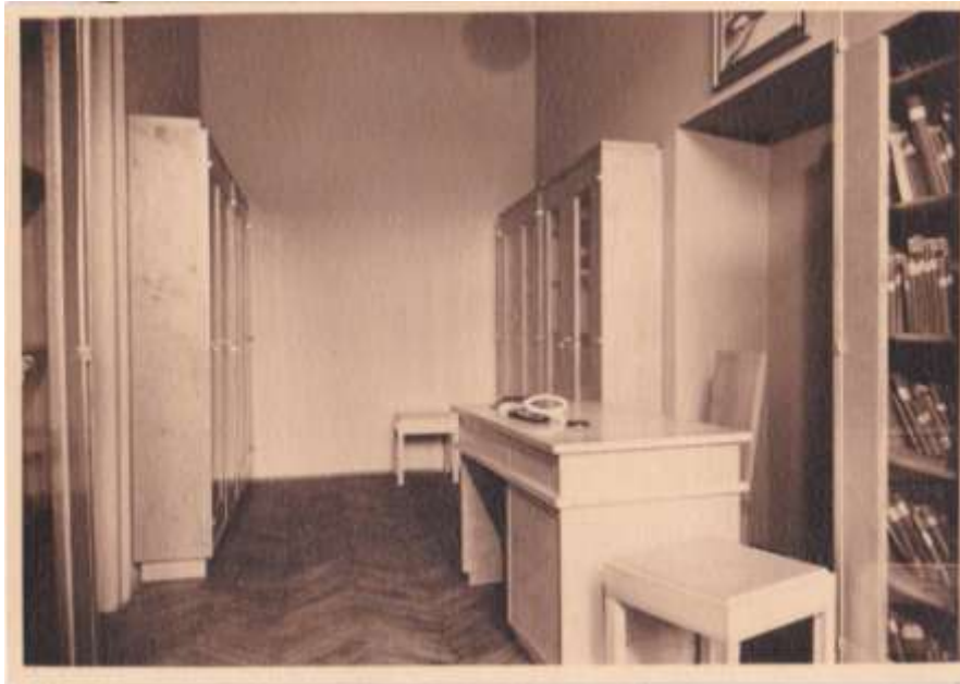
Biblioteka ŻGK i ŻS Ekonomiczno – Handlowej Krakowie.

Ul Loretańska 16. Zdjęcie pochodzi z kroniki szkolnej. Wrzesień 1938 r.