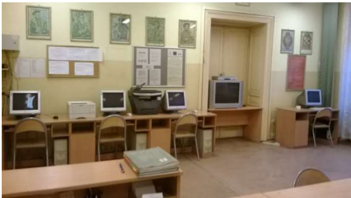
Pracownia multimedialna – obecnie.

Obecnie nasza biblioteka liczy 23554 jednostki biblioteczne, część z nich, podobnie jak w początkach jej istnienia, pochodzi z darów od uczniów i nauczycieli oraz różnych instytucji. Nauczyciel bibliotekarz zatrudniony w szkole musi mieć wyższe wykształcenie bibliotekoznawcze z przygotowaniem pedagogicznym, stale się dokształcać, uczestniczyć w kursach i innych formach doskonalenia. Aktualnie w bibliotece pracują dwie nauczycielki bibliotekarki. Organizują imprezy o zasięgu szkolnym i międzyszkolnym oraz różnego typu akcje, urządzają wystawy, przeprowadzają konkursy i plebiscyty, przygotowują uczniów do korzystania z innych bibliotek.