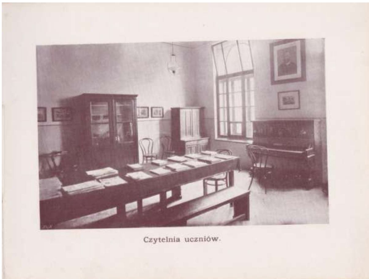
6. Czytelnia uczniów Akademii Handlowej.

Średnio w ciągu dnia bibliotekę i czytelnię odwiedzało 48 uczniów. Czytelnia otwarta była trzy razy w tygodniu, ale ze względu na potrzeby uczniów zdecydowano o jej codziennym funkcjonowaniu. W 1908 roku do biblioteki zapisanych było 168 uczniów. Łącznie wypożyczono 2089 książek.