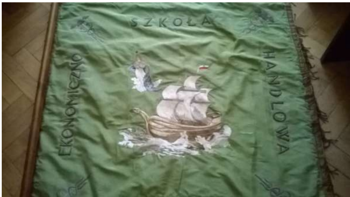
Pierwszy i najstarszy (zachowany) sztandar naszej szkoły – 1932 r.