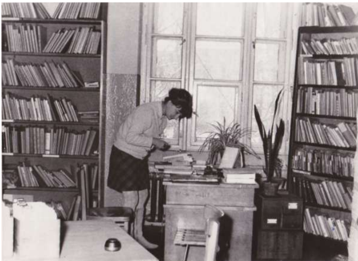
Zdjęcie pochodzi z kroniki szkolnej ZSE nr 1 w Krakowie. Wrzesień 1970 r.

Sprawozdanie biblioteki szkolnej Technikum i Liceum Ekonomicznego za rok szkolny 1970/1971 podaje, że liczba czytelników wynosiła 987 (młodzież: 580, uczniowie pracujący: 323, PSF i J: 22, grono i administracja: 62), liczba wypożyczeń zaś – 11114 tomów. Sprawozdanie mówi również o współpracy z Wojewódzką Biblioteką Pedagogiczną w zakresie wymiany książek. Podobnie jak obecnie, wywieszano w korytarzu szkolnym informacje o statystykach czytelnictwa poszczególnych klas, co zachęcało do współzawodnictwa.