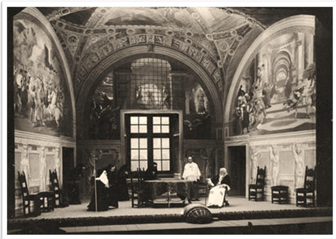
Kraków. Przedstawienie "Legion" Stanisława Wyspiańskiego w Teatrze im. Juliusza Słowackiego.