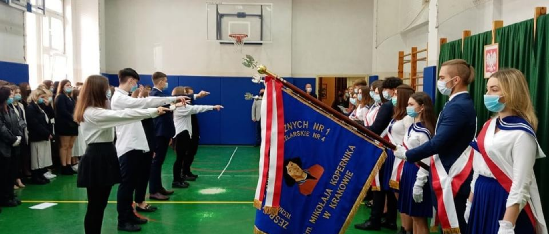
Ślubowanie uczniów klas pierwszych – 14.10